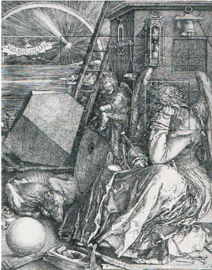
ALBERTO DURERO: Melancholia I Grabado sobre metal, 1514

“lo amo, pero aún más lo odio”. Lo amo para no perderlo, lo instalo en mí; pero porque lo odio, este otro en mí es un yo malo, soy malo, soy nulo, me mato. La queja sobre sí mismo es una queja contra el otro y la ejecución es un disfraz trágico de la masacre del otro.